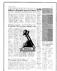
Peso: 1-1%, 12-11%

Gentiloni: necessario rendere più sano il nostro sistema bancario Boccia cita Padoan: sentiero stretto, visione larga